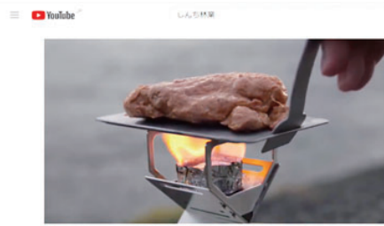
当社のYouTubeチャンネル

めることができました。当社の理念やイメージを象徴するロゴができたことが、販促活動に弾みをつけました。小規模事業者持続化補助金を活用し、ECサイトの構築やチラシの制作等に取り組んだほか、鶴来商工会主催のYouTube活用セミナーに参加し、SNSを活用した自社ブランドの情報発信について学び、積極的なPRに努めています。