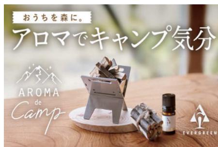
Makuakeのプロジェクトページ

進事業によるサポートを受け、商品のプロモーションを外部業者へ委託し、訴求力の高いページづくりを行いました。